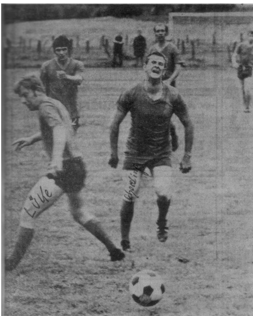
Obwohl dem Erkelner Lüke (links) diese Abwehraktion nicht ganz gelang, scheint der Amelunxener Angreifer nicht ganz mit seiner Aktion zufrieden zu sein.