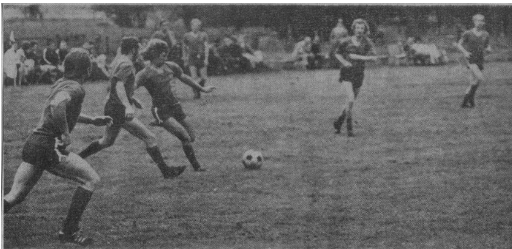
Aus dieser Szene entwickelte sich die 1:0-Führung für TuS Amelunxen in Erkeln. Die Erkelder Abwehr kam bei dem Schuß zu spät. Am Schluß trennte man sich 1:1.