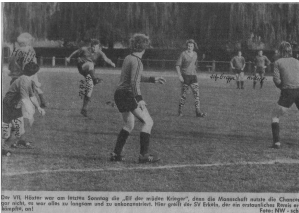
Der VfL Höxter war am letzten Sonntag die „Elf der müden Krieger“, denn die Mannschaft nutzte die Chancen gar nicht, es war alles zu langsam und zu unkonzentriert. Hier greift der SV Erkeln, der ein erstaunliches Remis erkämpfte, an!